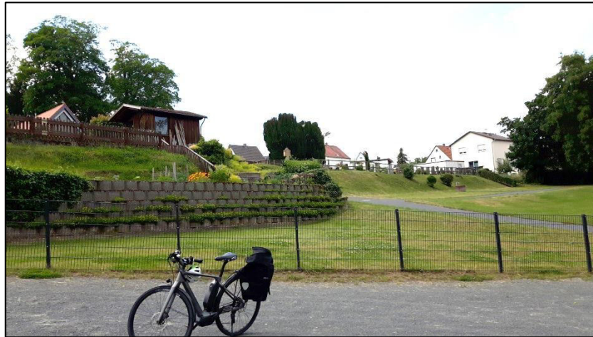
Abb. 4: Blick von Norden auf die Friedhofserweiterung mit angrenzender Gartenfläche