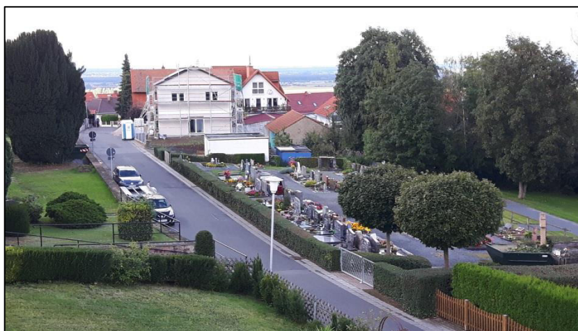
Abb. 3: Friedhof auf der Nordostseite der Talstraße

Gegenüber, auf der Südwestseite der Talstraße, erstreckt sich die Bebauung des historischen Ortskerns von Hering, die hinsichtlich ihrer Baustruktur noch die in dieser Region übliche dörfliche Dichte aufweist und mehrheitlich durch Wohnnutzung geprägt ist. Weiterhin schließt sich hier ein weiterer Teil des Friedhofs von Hering an.