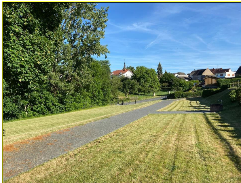
Abb. 5: Blick von Norden auf die Friedhofserweiterung; links ist die markante Baumhecke auf dem angrenzenden Flurstück Nr. 154 zu sehen