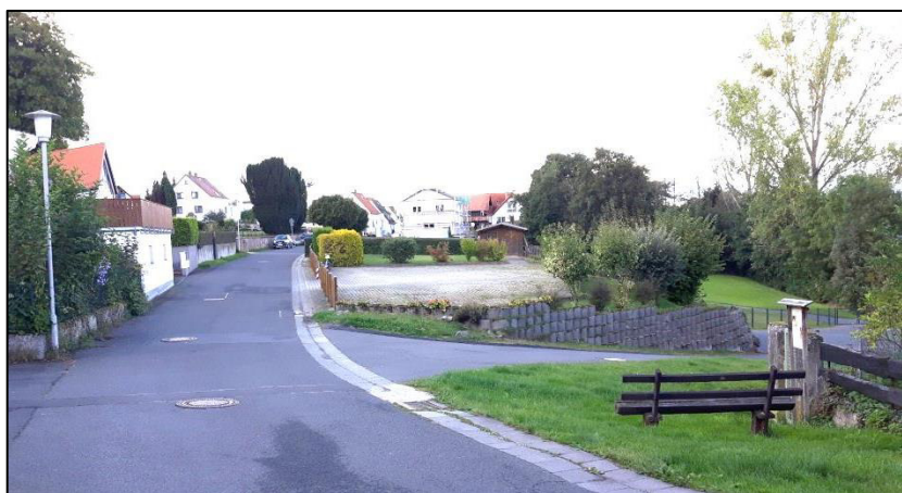
Abb. 2: Talstraße Rtg. Nordwest, rechts das Plangebiet mit der Stellplatzanlage

Das Plangebiet liegt an einem Nordosthang am Ortsrand von Hering. Es umfasst mit den Flurstücken 156 und 158 eine bereits bestehende Friedhofsfläche auf der Nordostseite der Talstraße und den direkt angrenzenden Erweiterungsbereich des Friedhofs. Weiterhin ist das Flurstück Nr. 159 Teil des Plangebiets. Dieses Flurstück wird zur Zeit durch eine Stellplatzanlage und eine Gartenfläche genutzt und ist für eine Nutzung als Wohngebiet vorgesehen.