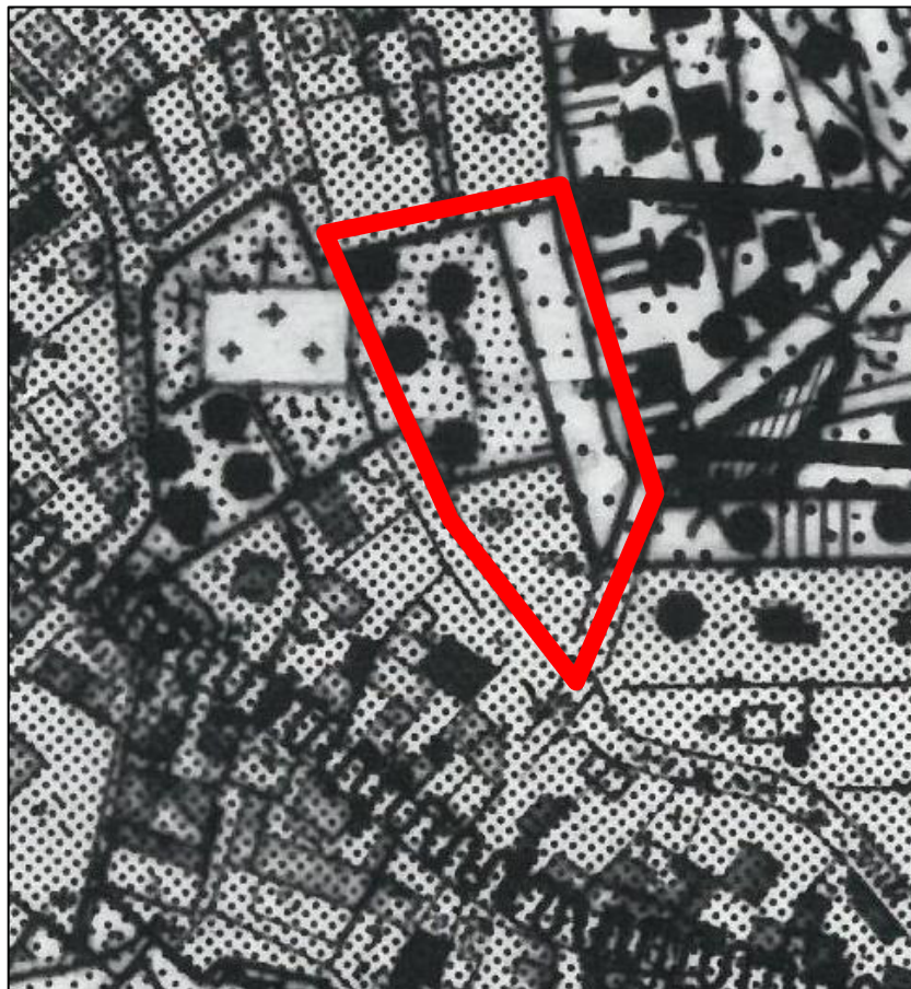
Abb. 7: Auszug aus dem Landschaftsplan der Gemeinde Otzberg (2001) mit Geltungsbereich (rot markiert)

Im Landschaftsplan der Gemeinde Otzberg (2001; Auszug siehe nachfolgende Abb. 7) wird der vorhandene Friedhof als "Grünfläche – Friedhof" und die Erweiterungsfläche als "Ökologisch bedeutsames Grünland" dargestellt. Die jetzt vorgesehene Wohnbebauung im Bereich des Flurstücks 159 wird als "Siedlungsfläche – Bestand" dargestellt.