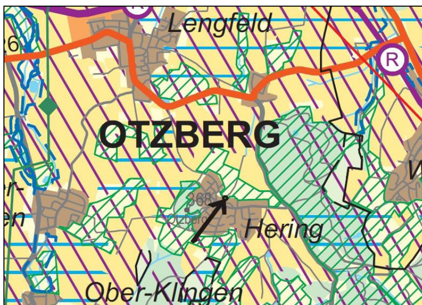
Abb. 6: Auszug aus dem RPS 2010 mit Geltungsbereich (schwarz markiert)

Im Regionalplan Südhessen 2010 (RPS 2010) liegt das Plangebiet in einem Übergangsbereich zwischen einer "Siedlungsfläche, Bestand" sowie einem "Vorbehaltsgebiet für Natur und Landschaft" und einem "Vorbehaltsgebiet für Landwirtschaft". Gemäß der Stellungnahme des Regierungspräsidiums Darmstadt gilt die Planung als an die Ziele der Raumordnung angepasst.